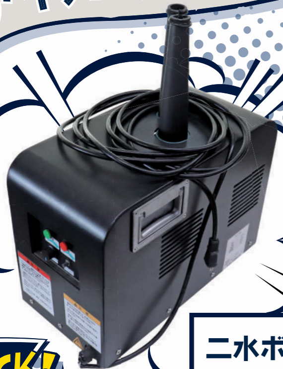
ニホボール マシン[1台]