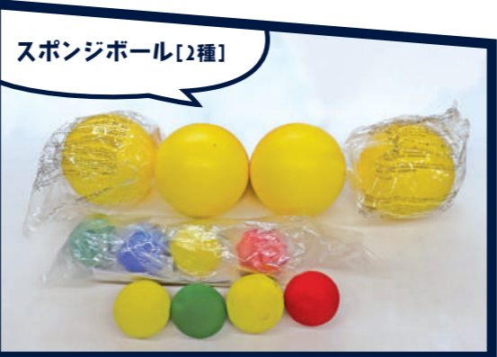
スポンジボール[2種]