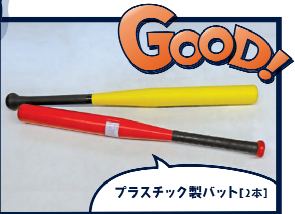
プラスチック製バット[2本]